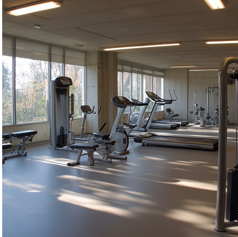
Für Fitness Studios